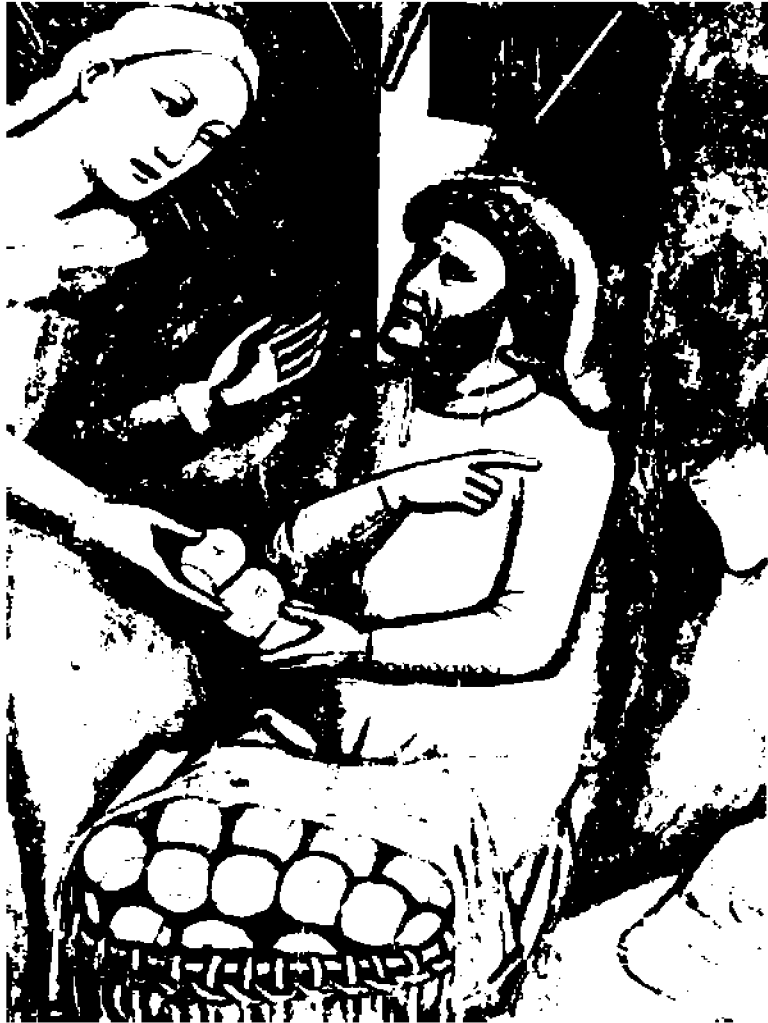
DETTAGLIO Nell'affresco di Cristoforo da Bologna, in San Giacomo Maggiore, si vede il 'pane di ruzzoli', prodotto nel forno di Santo Stefano